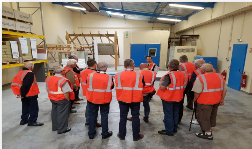
Laboratoire de R&D